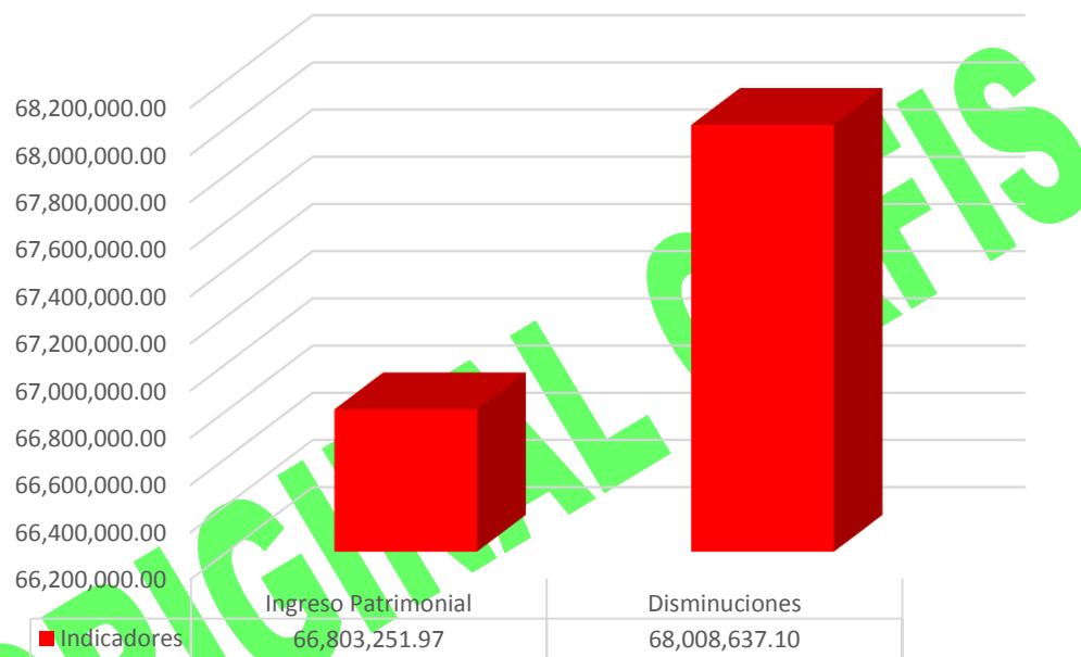
GRÁFICA 1 INGRESOS